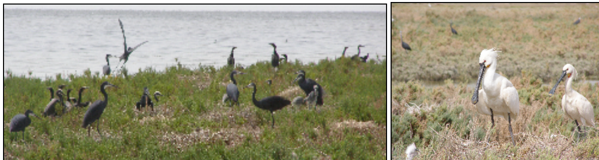
A gauche, Aigrettes des récifs et Cormorans africains, à droite, Spatules blanches ( Photos : MB, 05/09/08)