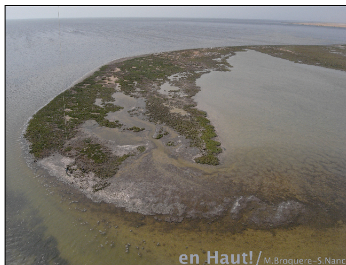
Photographie aérienne Ricoh GX100 du 05/09/2008- en Haut ! La zone de nidification vue aérienne de la péninsule depuis le Sud-Ouest.