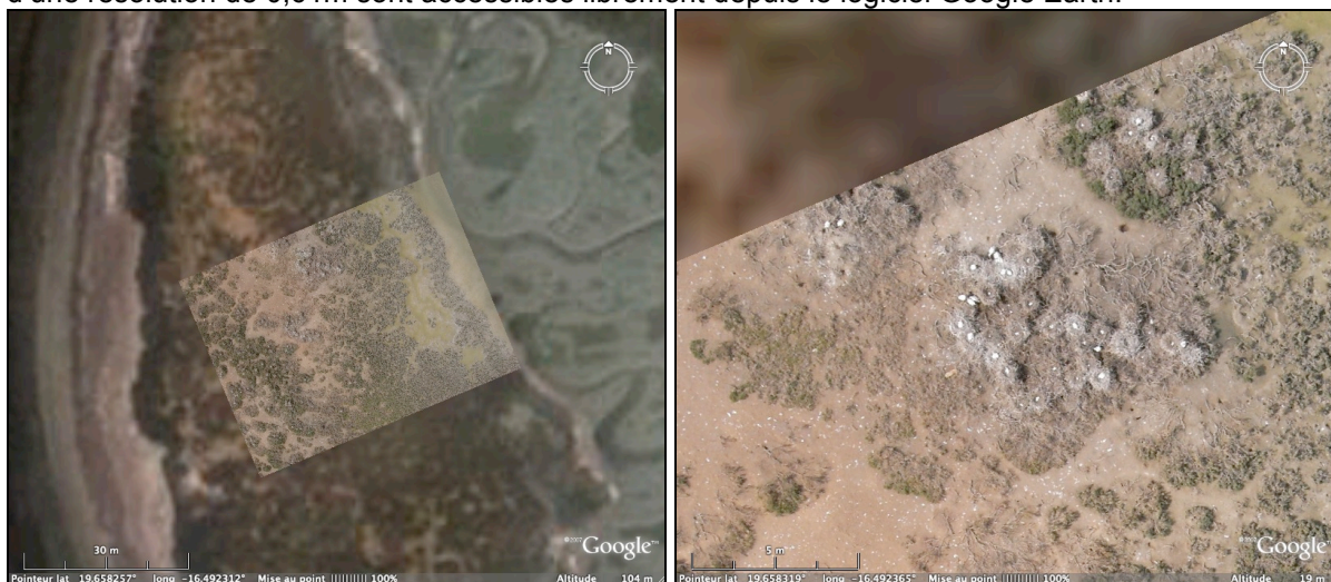
Image satellite Quickbird du 12/11/2002-Google Earth , photographie aérienne ( Ricoh GX100) du 06/09/2008- en Haut !

Après sélection des photographies, on recompose la zone en réalisant une mosaïque d'images à l'aide des photos d'altitudes et d'images satellites. Certaines images satellites Quickbirds d'une résolution de 0,61m sont accessibles librement depuis le logiciel Google Earth.